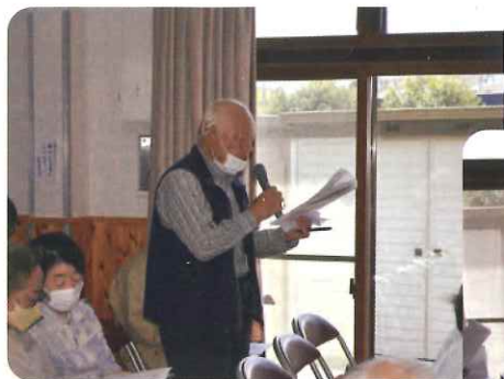
会場からの質問・意見