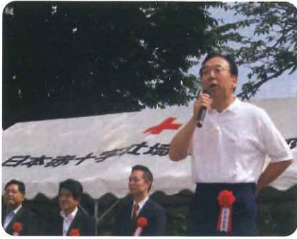
白石副会長、開会挨拶