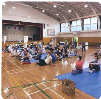
大砂土東小 避難所運営訓練

最後に、亡くなった方のご冥福をお祈りするとともに、被災地の1日も早い復旧・復興を願って、筆を置きます。（5月初旬投稿）