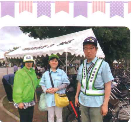
交通防犯部の皆さん