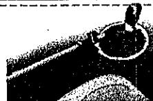
シフトレバーロック錠