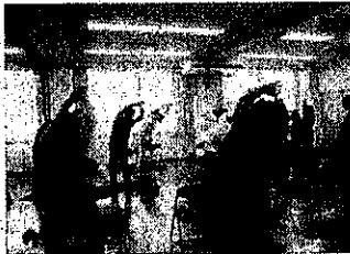
介護予防普及啓発事業 骨盤体操ヨガ