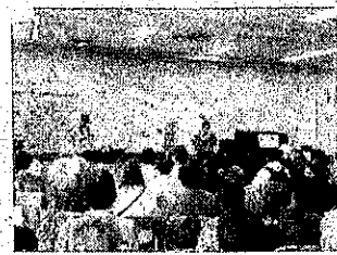
スプリングコンサート