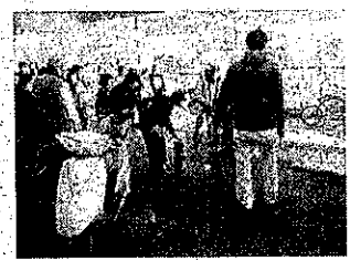
消防訓練も行いました

公民館の講座にご応募、ご参加いただきありがとうございます。 令和8年度も、いろいろな講座を計画しています。 詳細は、公民館ニュースに掲載します。