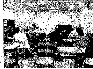
古典文学講座 「冬に読みたい枕草子」