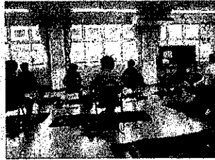
介護予防普及啓発事業 ますます元気教室