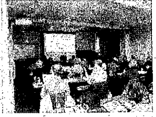
健康福祉講座「歯科医師 からの口から守る健康法」