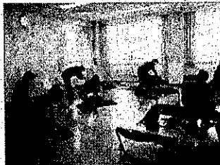
さいたま PUSH 講習会