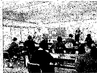
はじめてのウクレレ