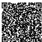
みぬマルシェ 定期便お申込み

まだ見ぬ、未だ知られない、ふるさと見沼の魅力。 郷土の大地で、情熱と愛情をもって育てられた農産物と 生産者に出会う、見沼地域の地産地消マルシェです。