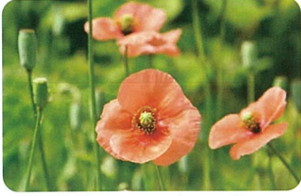
ナガミヒナゲシの花

葉がヨモギと似ています。触つたり口に 入れたり しないよ うにヨモ ギ採りの 際にはよ く見極め てください い。