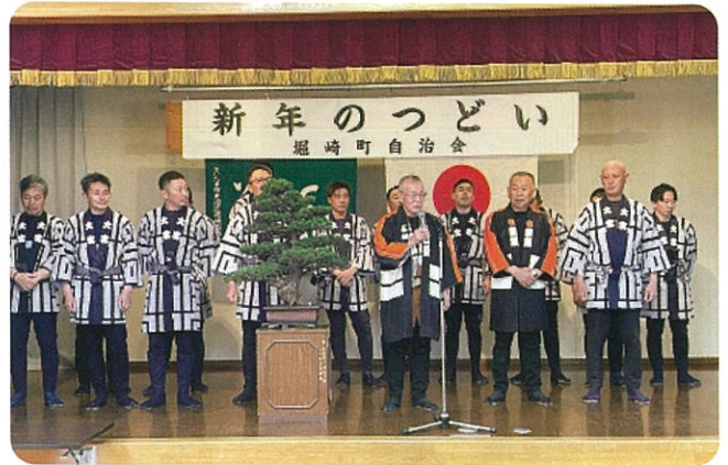
大宮若鷺会の皆さん