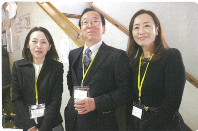
第二会計部長 副会長 第一会計部長