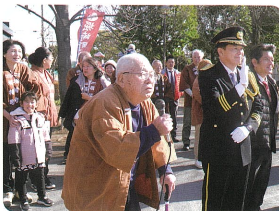
堀崎町祭り実行委員長